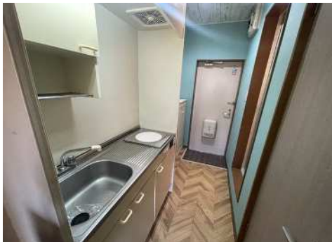
◎図面や画像と現状に相違がある場合は現状優先とします